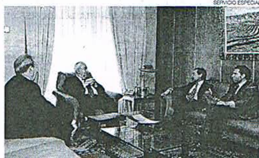
▶▶ Biel (zda), ayer, con los miembros de ADEA.

El número de empresas que mantiene contactos comerciales con Brasil es cada vez mayor, destacando las exportaciones de empresas tecnológicas, sector construcción, servicios y fabricación de bienes de equipo y componentes para automóviles. La Cámara de Comercio Brasil-España, entidad dedicada a promover los intercambios económicos entre los dos países, cuenta entre sus asociados con más de 250 empresas, tanto españolas como brasileñas, que representan el eje de las relaciones comerciales bilaterales y más del 90% de la inversión en el país. ■